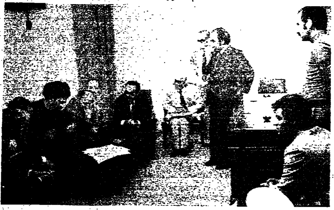
سبحة الإمام الصدر يطلع على نتائج الفرض

بدأت جمعة جامع البحر بتشييد المرحلة الثانية من المشروع ، بالتعاون مع الجمعية ، والتمويل الوطني والصليب الأحمر .